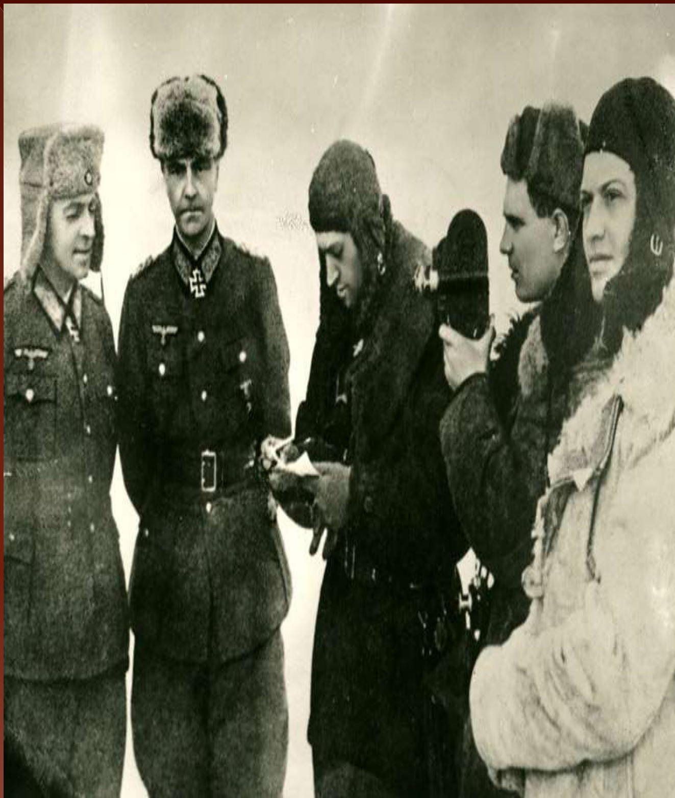
Пленение генерал-фельдмаршала Паулюса в Сталинграде, 1943 год.