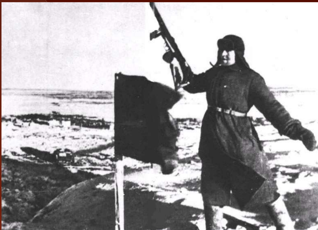
Последний выстрел на Мамаевом Кургане, 1943 год.