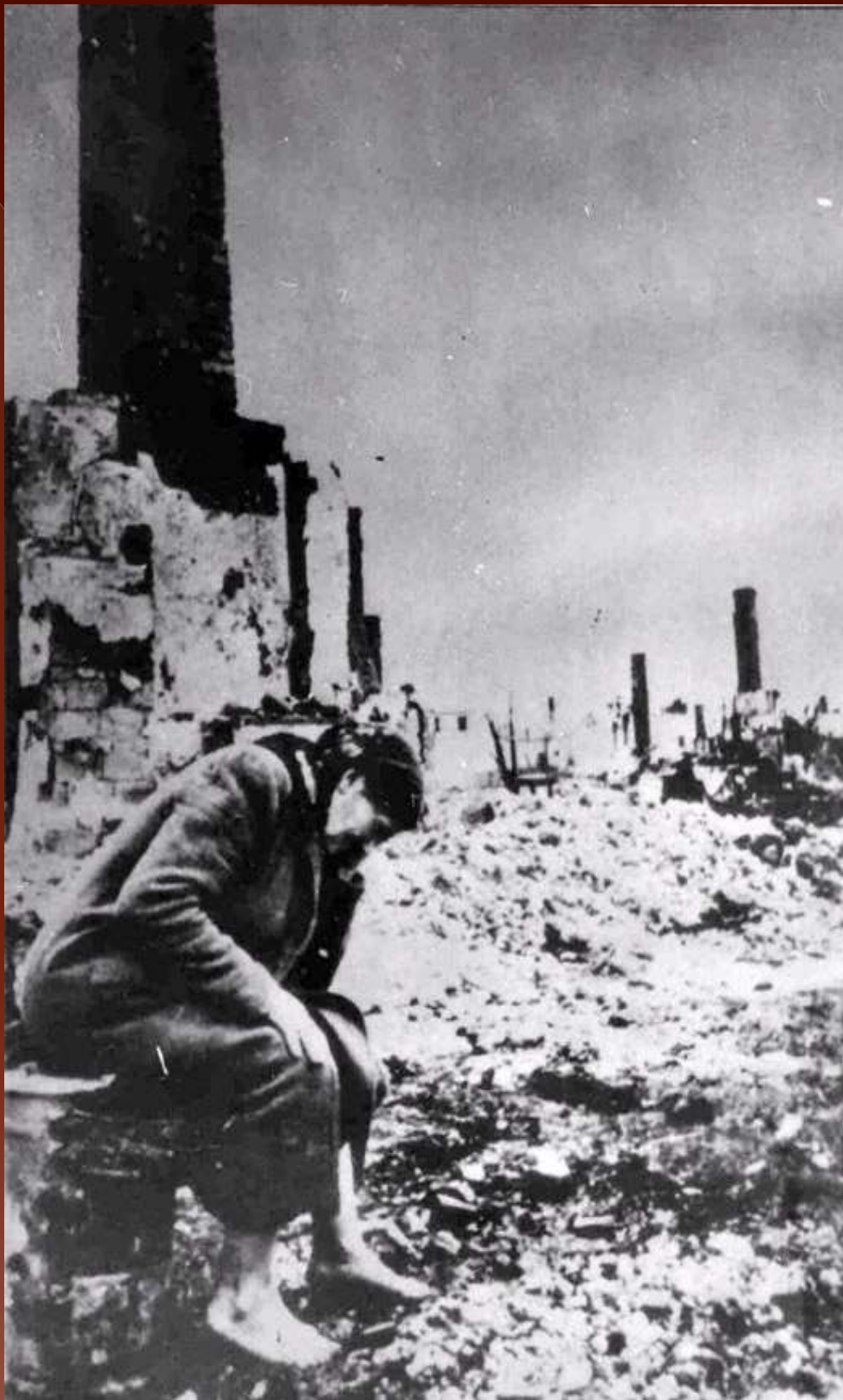
Пришла беда, Сталинград, 1942 год.