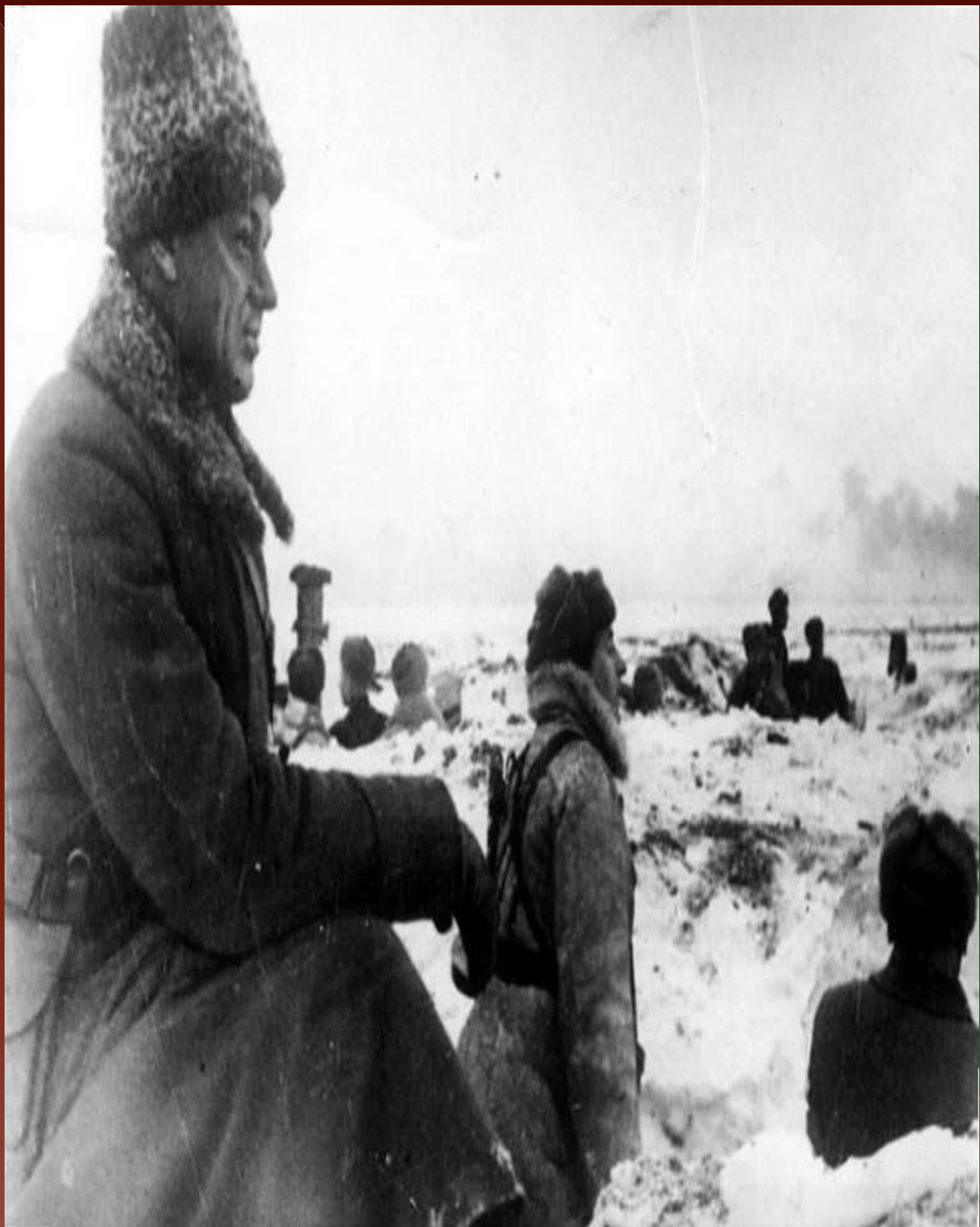
Командующий войсками Донского фронта генерал-лейтенант Рокоссовский К.К. на боевой позиции в районе Сталинграда, 1942 год.