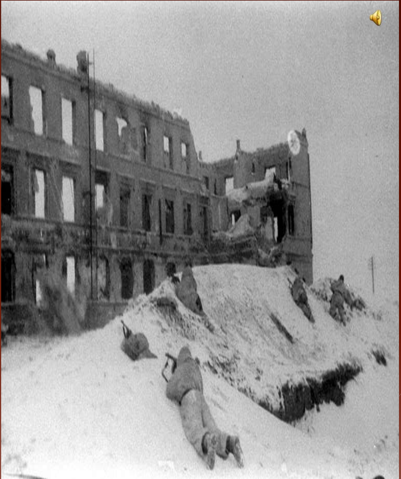
Бойцы 64-й армии ведут бой за дом в одном из районов Сталинграда, 1942 год.