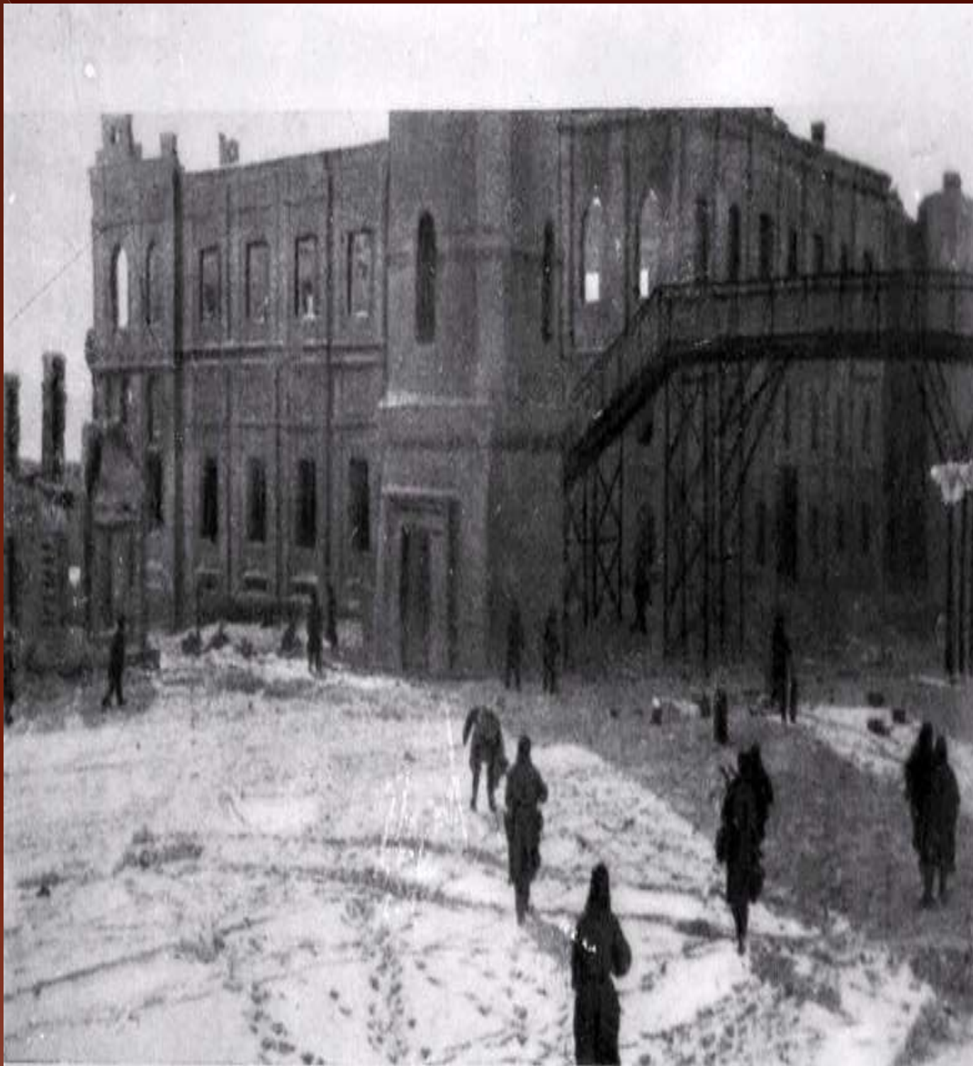
Штурм железнодорожного вокзала, Сталинград, 1943 год.