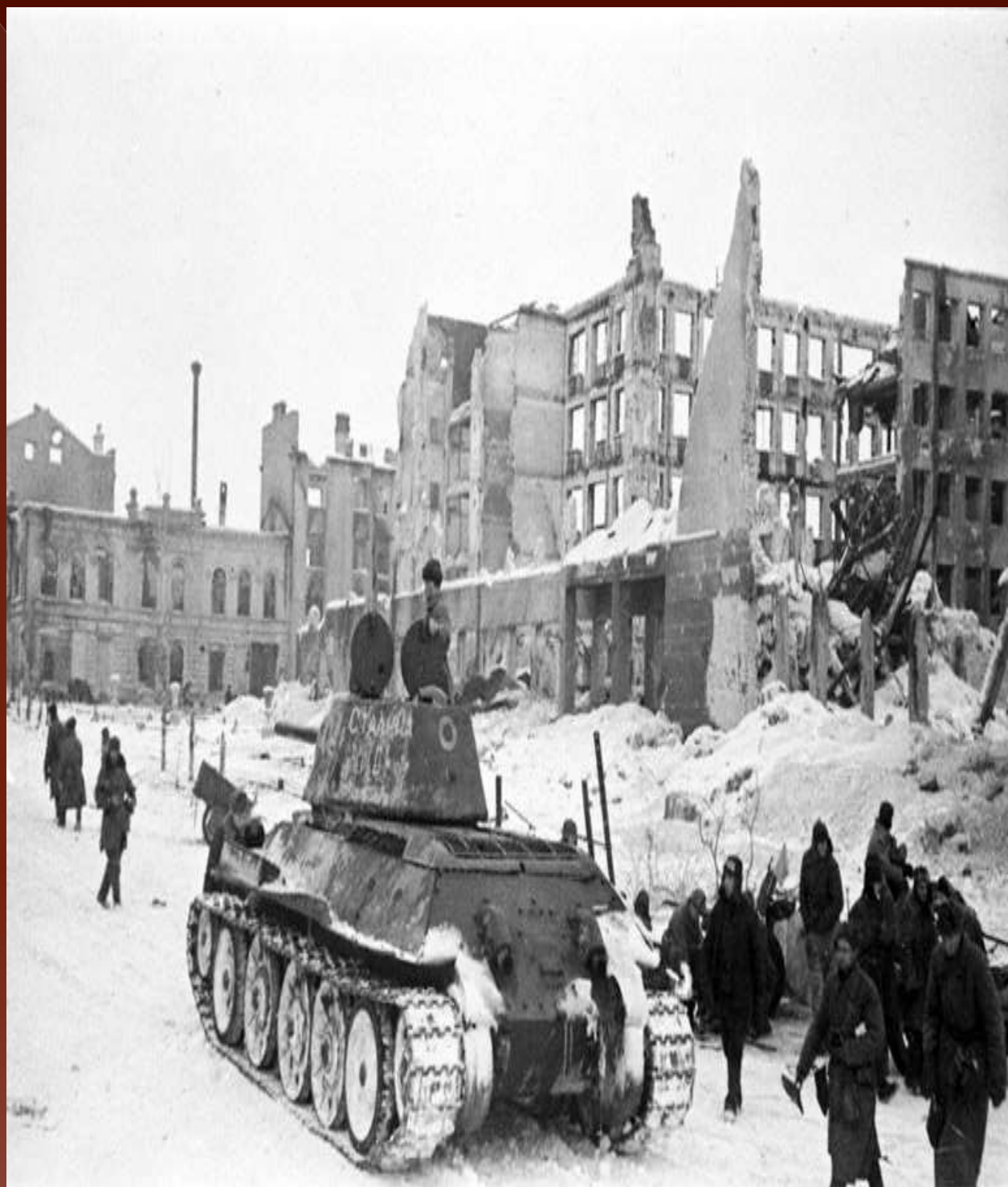
Танки Н-ской бригады входят в город Сталинград с победоносным флагом, 1943 год.