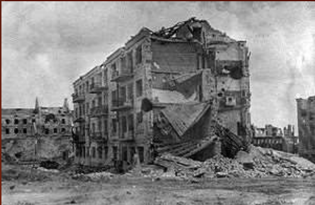
Дом Павлова после окончания Сталинградской битвы