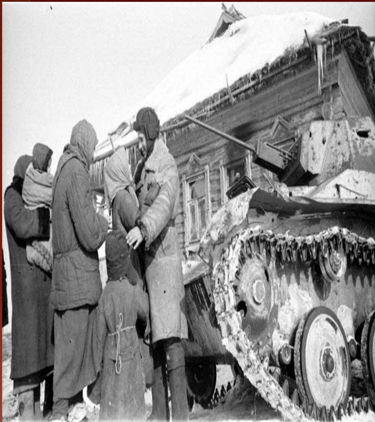
Женщины и дети встречают солдат-освободителей, район Сталинграда, 1943 год.