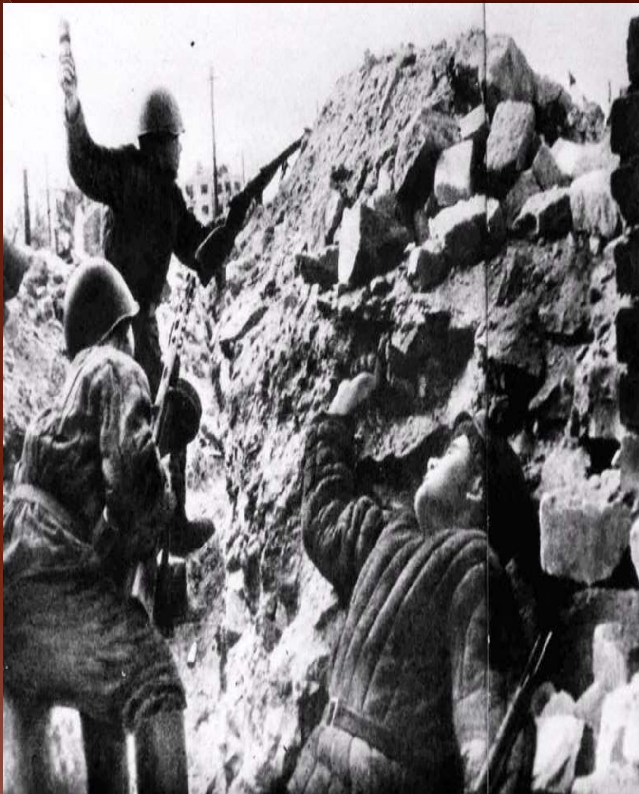
Бой в центре города, 1943 год.