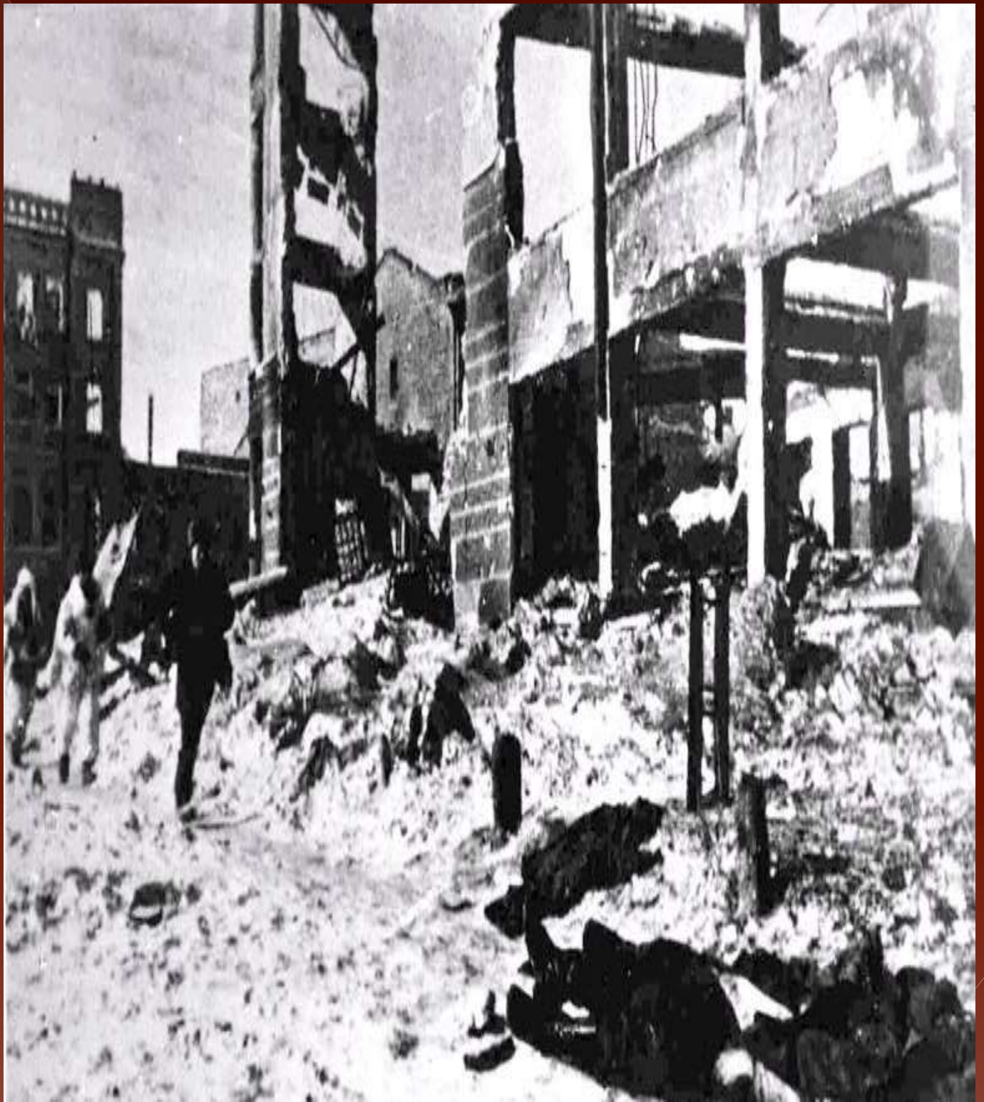
Бой шёл за каждый дом. Сталинград, 1942 год.