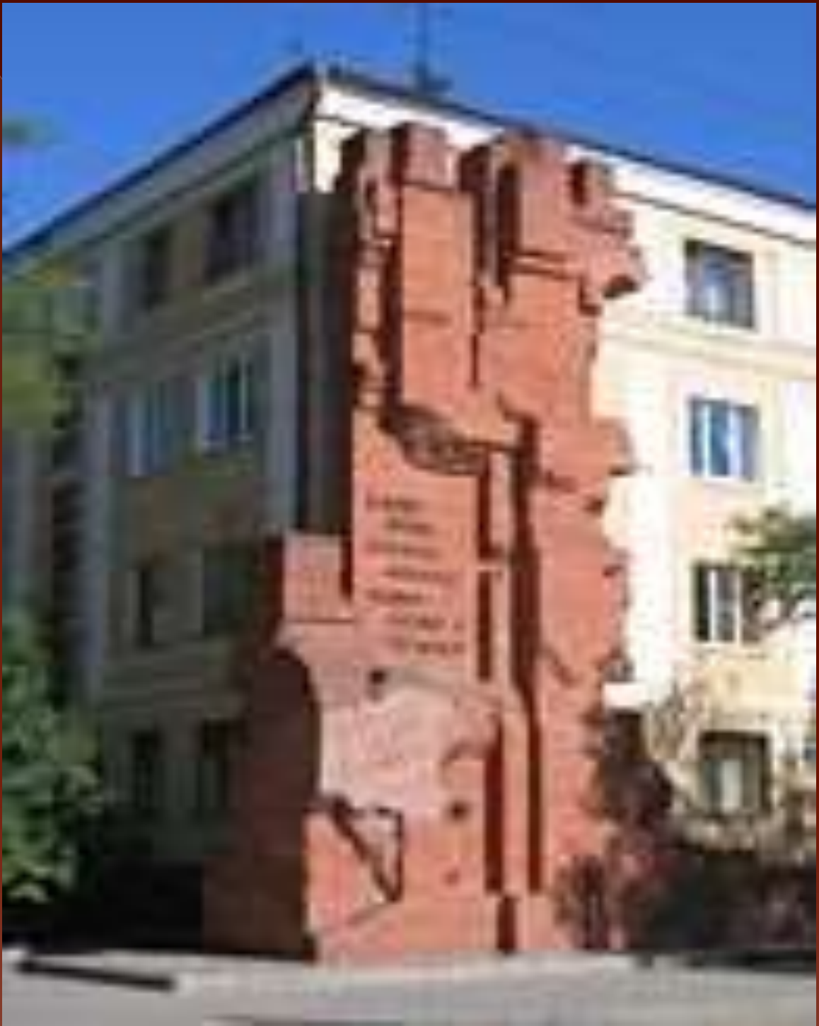
Современный вид на дом Павлова со стороны Советской улицы