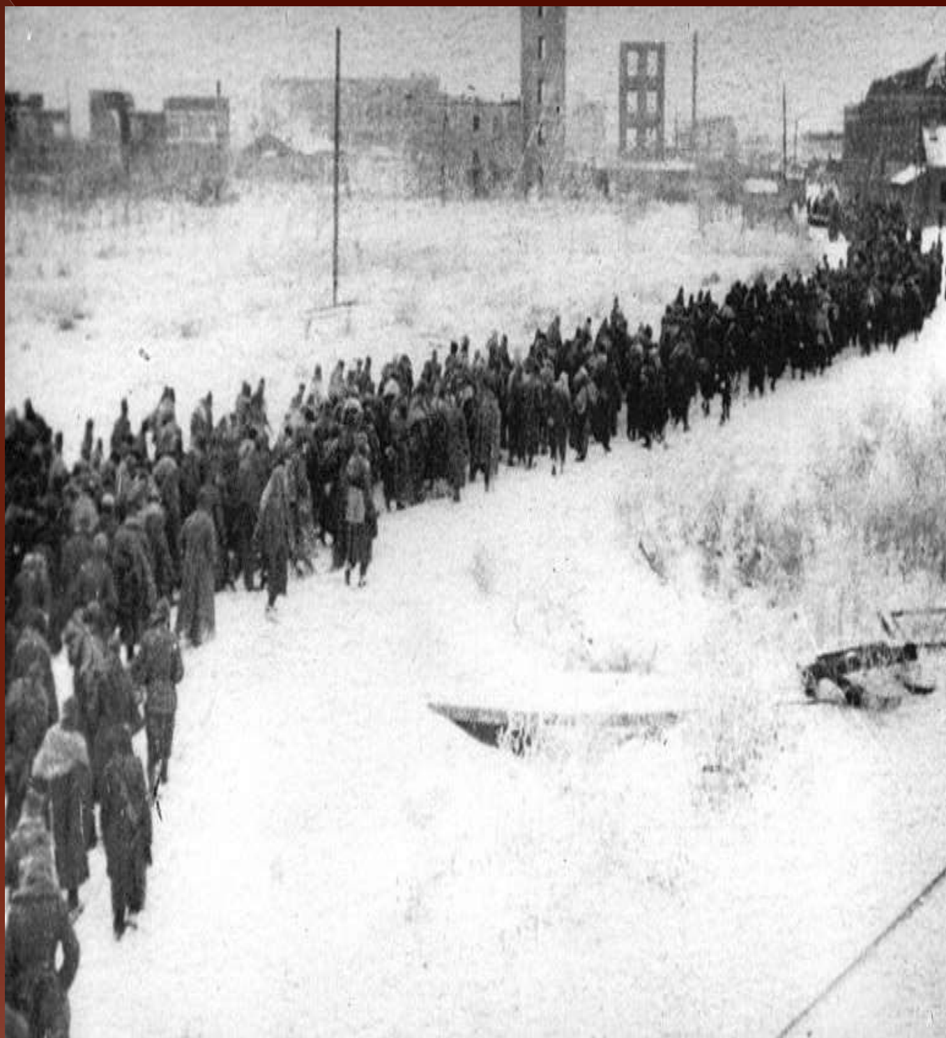
Колонна немецких военнопленных проходят через Сталинград, 1943 год.