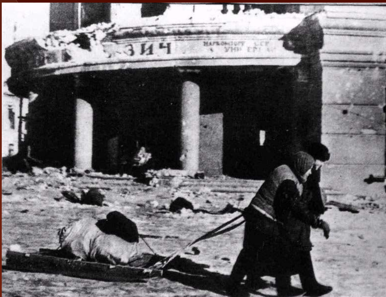
Возвращение, Сталинград, 1943 год.