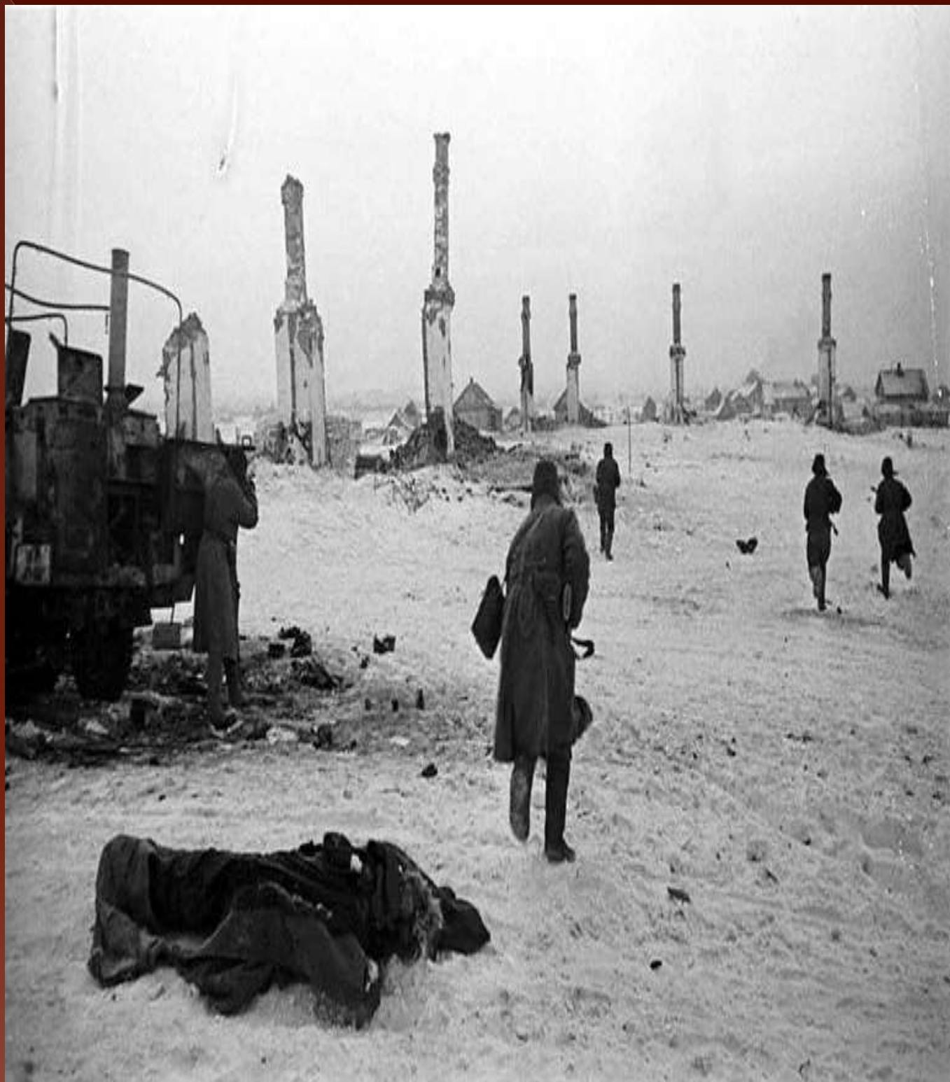
Бой в районе Сталинграда, 1942 год.