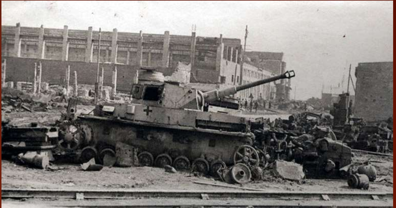
Разбитая немецкая техника в районе тракторного завода, Сталинград, 1943 год.